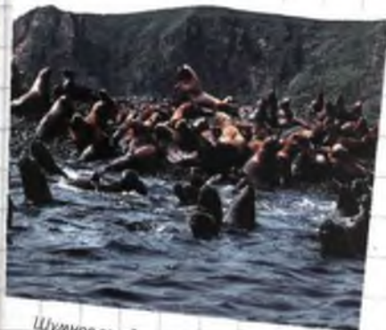
Шумное соседство с людьми и портом Невельска несколько не смущает сивучей, устраивающих здесь одну из самых больших своих колоний.

на он привез образцы ее семян. Начинать знакомство с островом-«рыбой» сподручнее с «хвоста». Сам Южно-Сахалинск невелик. В 1855-го по 1875-й и с 1905-го по 1945 год город принадлежал японцам. Их похожие на улыбки домишки с раздвижными стенами и печами-маньчжурками можно было застать здесь еще в конце 1950-х. Японцы уходили в панике, бросая жильё и скарб, и на смену им приходили новые жильцы - советские строители, геологи, журналисты, приехавшие на Сахалин по путевке. Самих домиков уже нет: Южный, как называют город сахалинцы, - город ветров, и в свое время пожары в нем вспыхивали едва ли не каждый день. В них сгинула практически вся деревянная застройка. Но до сих пор в сахалинских семьях хранятся изысканные туалеты и столики, раскладные зеркала и ширмы из темной вишни - память о бывших вла-