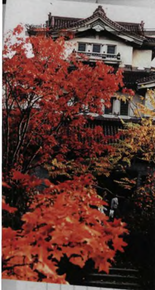
Краеведческий музей – одно из немногих сооружений в Южно-Сахалинске уцелевших со времен японского владычества. Здание построили в 1937 году под губернаторство, а уже через десять лет в его комнатах поселились чучела оленей.

Анивский залив – это то, что обнимает «хвост рыбы». Он расположен на широте Краснодара и Одессы и с давних пор является главным морским курортом сахалинского юга. Зимой сюда ездят ловить корюшку с ледяного припая, что приносит море. Летом – купаться и загорать на дивных анивских пляжах. Сахалинский юг – край непуганых рыболовов. Всего на острове тысяча рек и семь тысяч озер, и в них полно рыбы. Рассказывают, что в XIX веке японцы черпали ее ведрами. Сейчас, конечно, не то. Повеет – поймашь тайменя (рыба семейства лососевых размером до полутора метров с нежной сладкой красной плотью), не повезет – обойдешься форелью сантиметров в 20–25. Домой такую никто не берет: ее пекут на костре прямо в чешуе и уничтожают на месте. Пейзажи здесь чисто крымские. Это отмечал еще Чехов, побывавший на Сахалине в 1890-м. Впереди море с пологим песчаным дном, по сторонам бесконечная линия прибоя, зади горы в цвету-