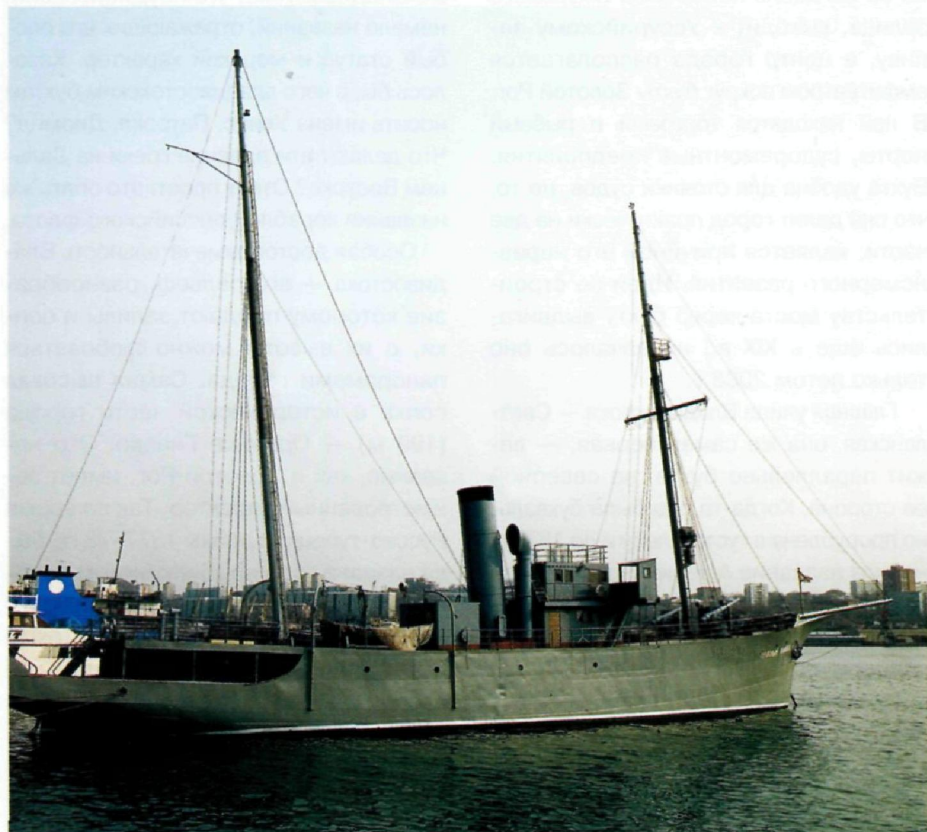
Мемориальный корабль-музей «Красный вымпел» когда-то охранял территориальные воды Дальнего Востока.

■ На Корабельной набережной у бухты Золотой Рог в 1975 г., в честь 30-летия Победы, была установлена в качестве мемориала подводная лодка С-56, служившая в Тихоокеанском флоте и удостоенная гвардейского звания за боевые заслуги в Великой Отечественной. Лодка 19 раз объявлялась погибшей, потопила 4 вражеских корабля и подбила один.