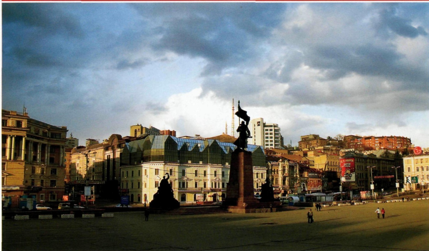
Памятник Борцам за Власть Советов на Дальнем Востоке на одноименной площади в центре города.

Во Владивостоке расположен старейший и крупнейший музей Дальнего Востока — Приморский государственный объединенный музей имени В. К. Арсеньева с множеством