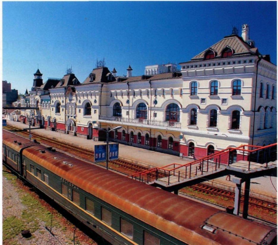
Железнодорожный вокзал Владивостока. Здесь заканчивается Транссибирская магистраль.