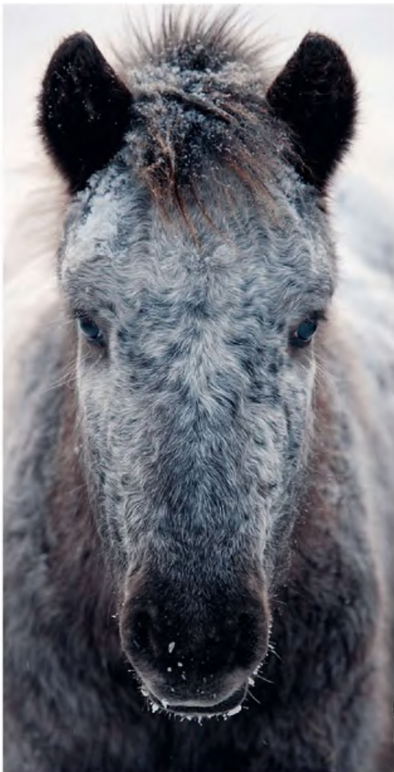
Породистая якутская лошадь – приземистая (рост 134–138 сантиметров в холке), широкогрудая; на зиму обрастает шерстью от 7 до 15 сантиметров длиной.

протискивается сквозь непролазные переплетения заснеженного тальника (ивовый кустарник), отыскивает подходящую прогалину – летом здесь было озеро, болото или алас (сугубо якутское явление – результат лесного пожара на вечной мерзлоте). Косяк выстраивается головами к тальнику, крупами – к открытому месту и начинает мерно... пощипывать травку. Лошадь кромкой переднего копыта разбивает наст до самой земли и подгребает снег под себя: под снегом сохранились стебли осоки, других диких злаков. Вот и корм. Осенью на такой диете лошадь отъедается лучше, чем летом, когда на тайгу обрушиваются мириады мошки, мокрецов и оводов. В Якутии существует легенда, вполне правдоподобная, что лошади сами пришли к человеку, спаса-