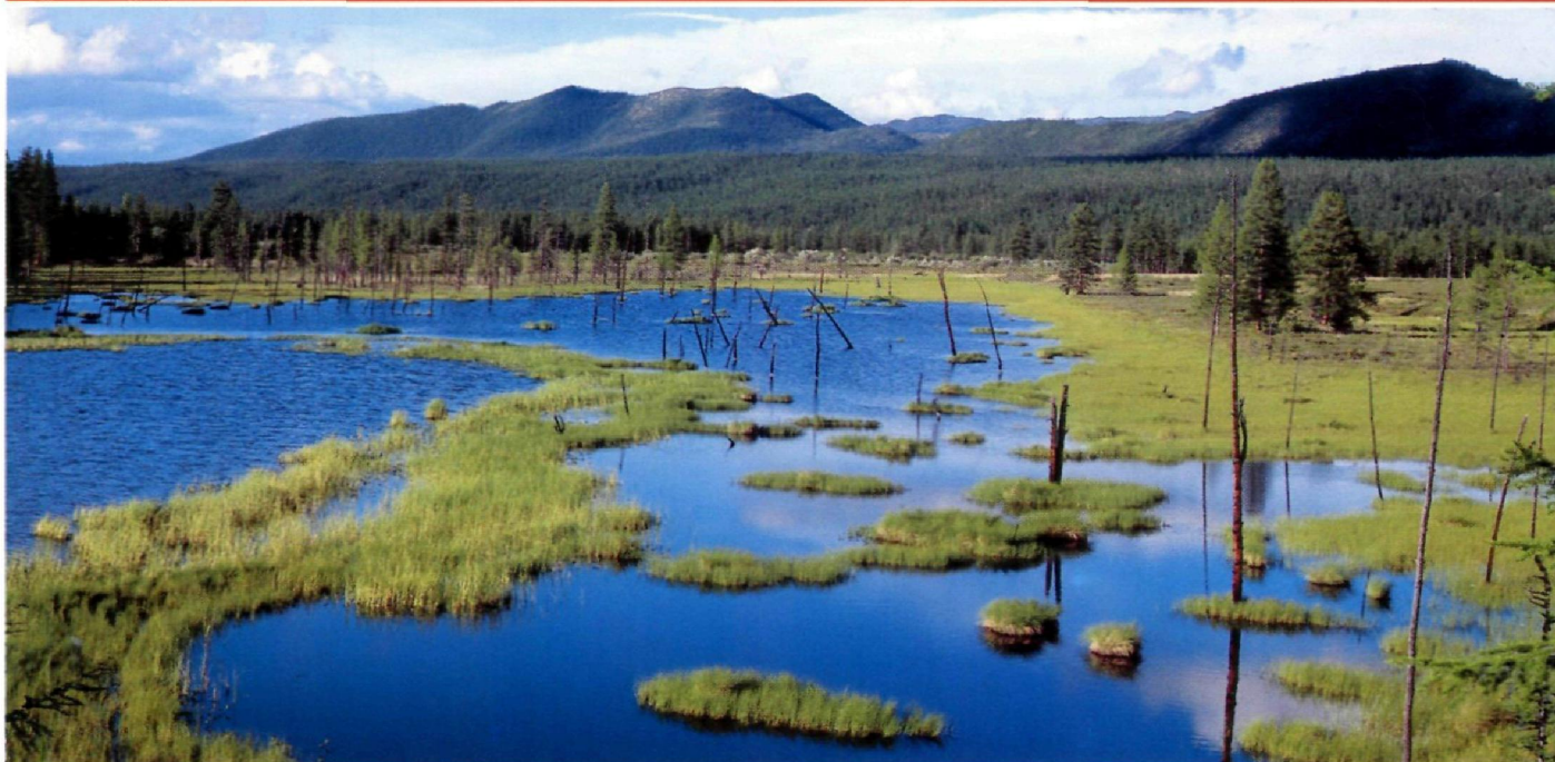
Долина реки Сунтар.

В I тыс. до н.э. здесь появились предки эвенков и эвенков. Сейчас коренное население Якутии составляют якуты, эвенки и эвены, юагиры, чукчи и долганы. При этом якуты, давшие имя всему краю, представляют собой довольно молодой этнос — к моменту его формирования побережье самой крупной якутской реки Лены уже было освоено протоякутскими, а также тунгусо-манчжурскими племенами. Самоназвание якутов «саха», что отразилось в официальном названии, Республика Саха. Представители других племен звали их «яко». Это название переняли и русские поселенцы: так земля народа «саха», или по-русски