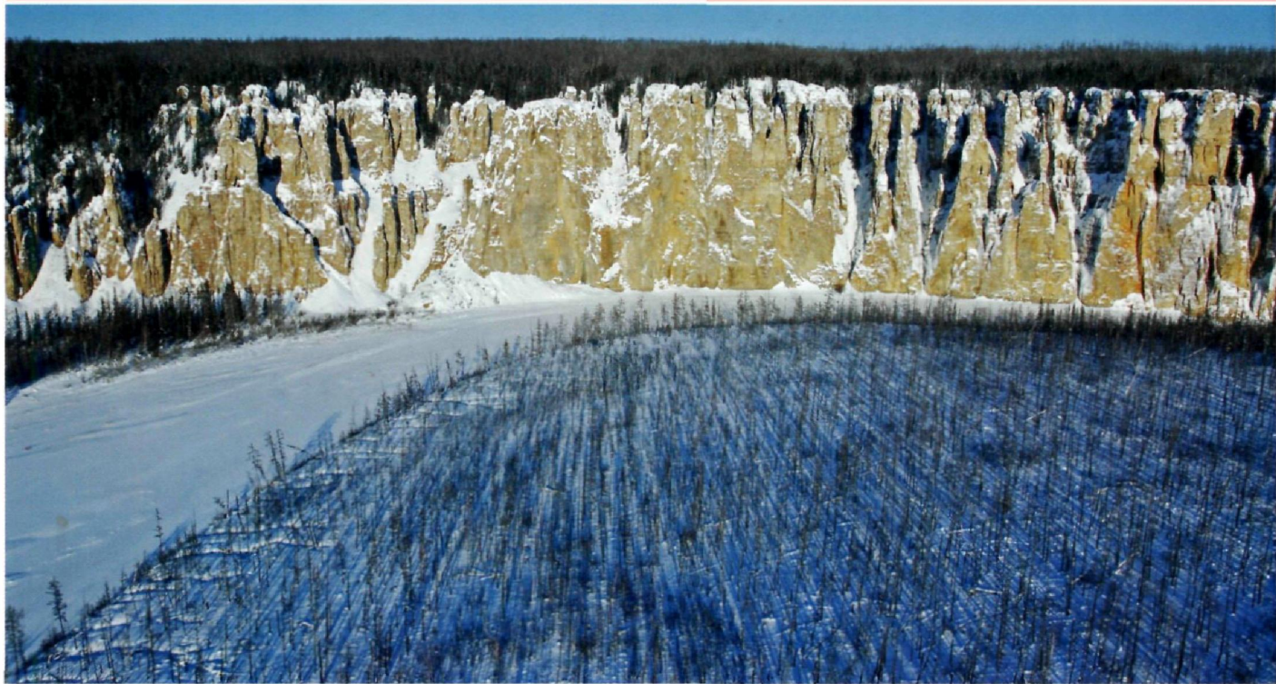
«Сиинские столбы» в национальном парке «Сиинэ». Парк расположен в бассейне реки Синая на Приленском плато.

основным способом передвижения: в регионе действуют 2 морских порта и Арктическое морское пароходство, 6 речных портов и 3 судоходные компании. Центральным транспортным узлом является Якутск, через который