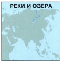
РЕКИ И ОЗЕРА