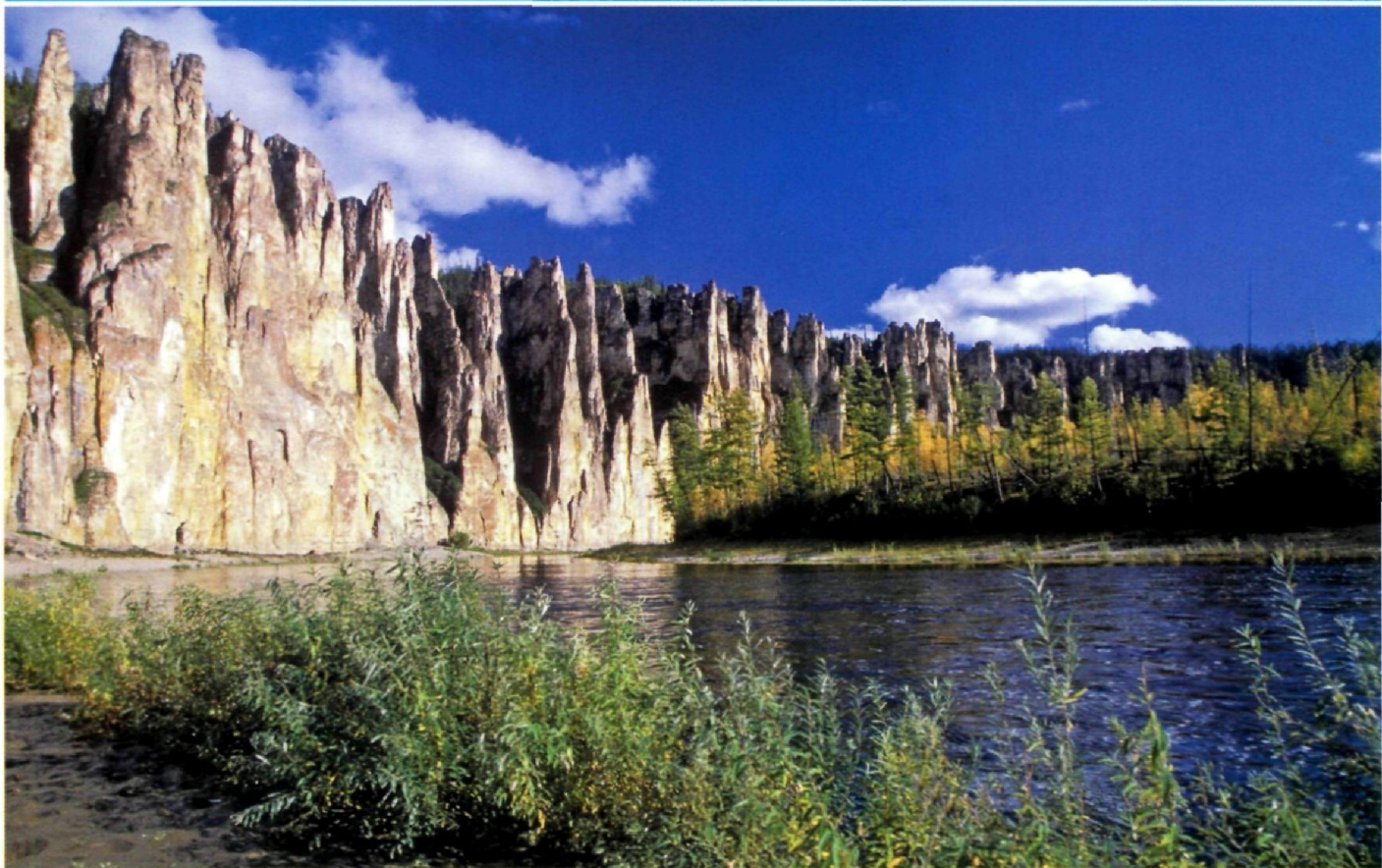
Знаменитые «Ленские столбы», примечательное геологическое образование и национальный парк находится в 104 км вверх по течению от г. Покровска в Якутии.

особенно заметно после впадения в нее Олекмы и значительного расширения русла от с. Бестях до Якутска, где оно достигает 5 км. Склоны реки в среднем течении чаще всего покрыты хвойными деревьями с изредка проступающими лугами.