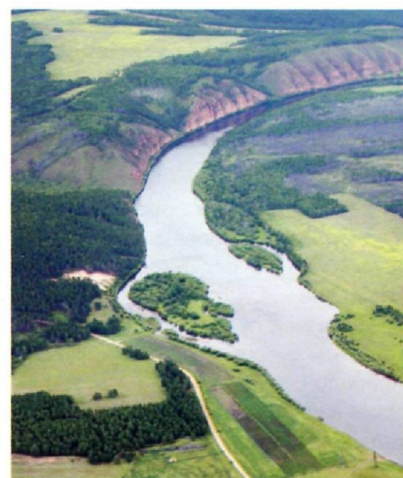
Извилистое и быстрое верхнее течение Лены.

Лена большая река, самая крупная из рек России, чей бассейн полностью находится в границах страны. Вокруг нее обживаются люди, но сохраняется мир естественной природы.