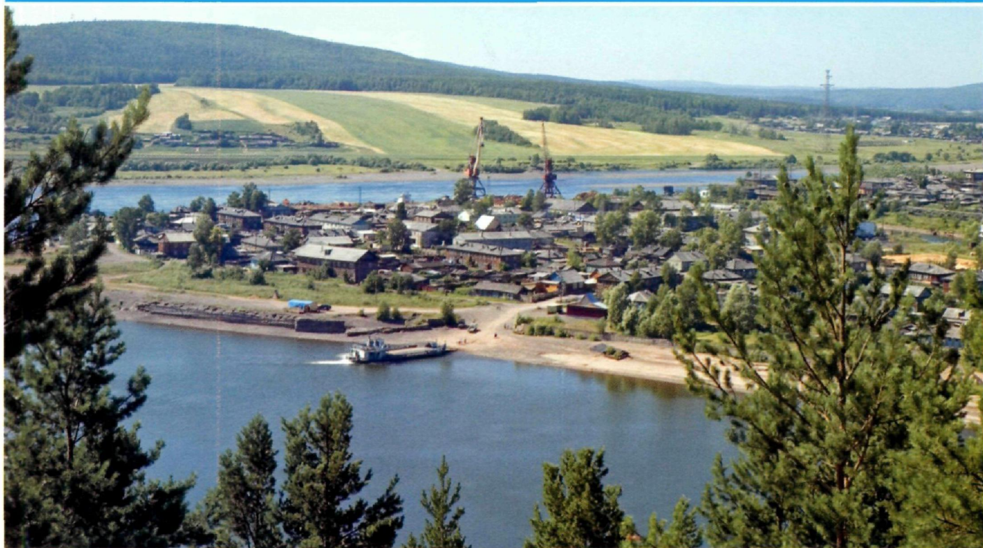
Город Киренск расположен в месте впадения р. Киренга в Лену. Был основан в 1630 г. как погост отрядом Василия Бугра, один из старейших городов Иркутской области.

В 1643 г Ленский острог был перенесен на новое, более удобное место, в долину Туймаада, давно освоенную якутами, и тогда же получил статус города и название Якутск. Сейчас это самый крупный город на берегах Лены. Много веков он был опорной базой изучения и освоения Сибири. Отсюда уходили в свой путь Дежнев, Атласов, Поярков, Хабаров и другие. В Якутске в разное время побывали Беринг, братья Лаптевы, Челюскин. С 1954 г начался алмазный этап истории Якутии, который превращает сибирское поселение на Лене в богатый город, живущий по-европейски.