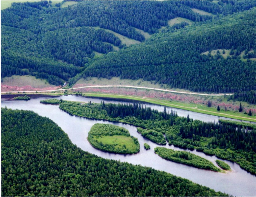
Живописные зеленые берега и островки Лены в ее верхнем течении.