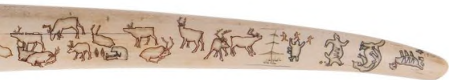
ВВЕРХУ И ВНИЗУ: МОРЖОВЫЙ КЛЫК. АВТОР: МАСТЕР РАПХЫРГИН. 1930-Е ГОДЫ. ДЛИНА КЛЫКА 77 СМ. ГАВРИРОВКА. ЦВЕТНОЙ КАРАНДАШ. В ЦЕНТРЕ СЛЕВА: ЧУКОТСКИЙ БОЖОК-ОБЕРЕГ ПЕЛИКЕН. АВТОР: ИВАН СЕЙГУТЕГИН. 1961 Г. МОРЖОВЫЙ КЛЫК. 8,5Х4,5Х4,5 СМ. РЕЗЬБА (СЛЕВА). НЕИЗВЕСТНЫЙ АВТОР 1960-Е ГОДЫ. МОРЖОВЫЙ КЛЫК. 9,0Х4,0Х4,0 СМ. РЕЗЬБА (СПРАВА)