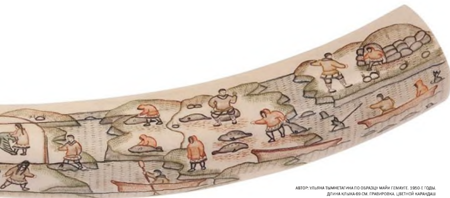
АВТОР: УЛЬЯНА ТЫМНЕТАГИНА ПО ОБРАЗЦУ МАЙИ ГЕМАУГЕ. 1950-Е ГОДЫ. ДЛИНА КЛЫКА 69 СМ. ГАВИРОВКА. ЦВЕТНОЙ КАРАНДАШ