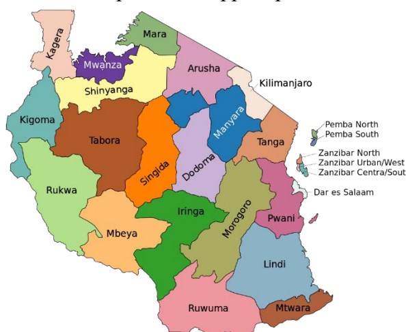
Рисунок 1. Карта административно-территориального деления Танзании.