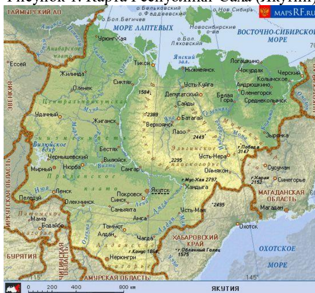
Рисунок 1. Карта Республики Саха (Якутии)