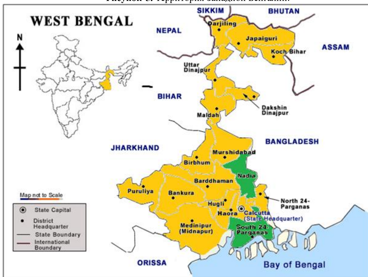
Рисунок 5. Территория Западной Бенгалии.