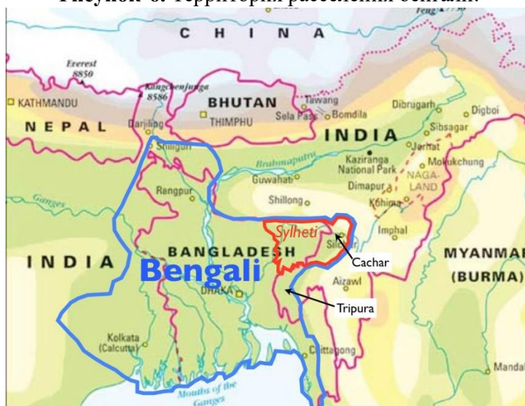
Рисунок 6. Территория расселения бенгали.