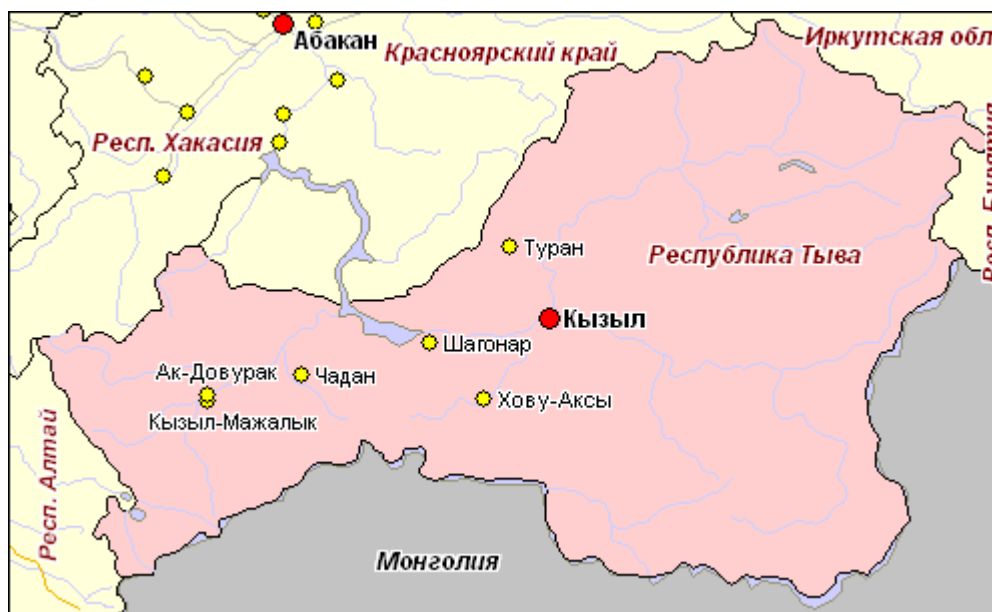
Рисунок 1. Карта Республики Тыва