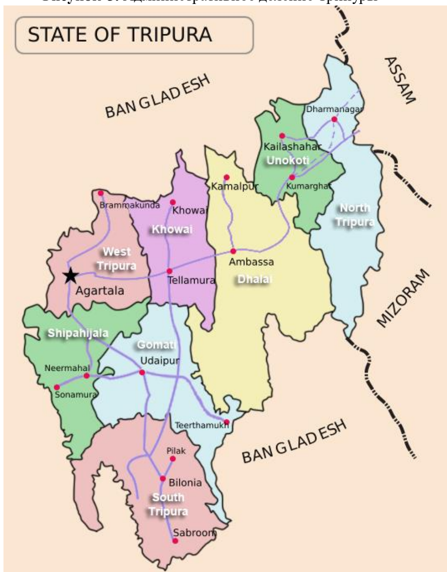
Рисунок 3. Административное деление Трипуры