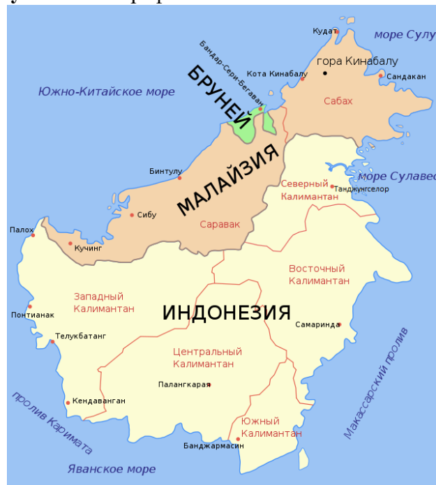
Рисунок 2. Географическое положение штата Сабах