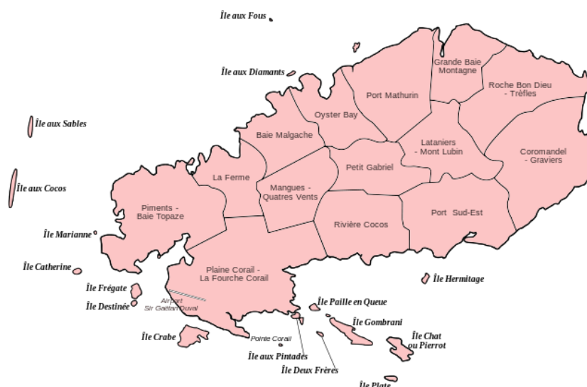
Рисунок 2. Административно-территориальное деление Родригеса