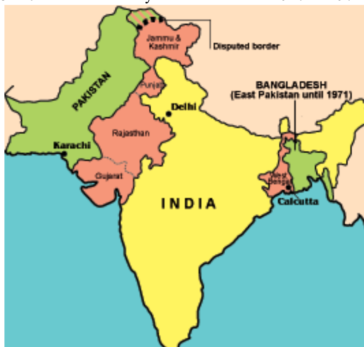
Рисунок 2. Исламская Республика Пакистан с 1947 по 1971 гг.