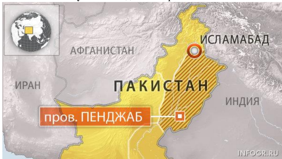
Рисунок 4. Пенджаб на карте Пакистана