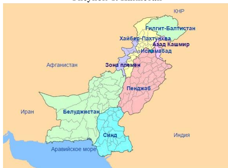
Рисунок 1. Пакистан