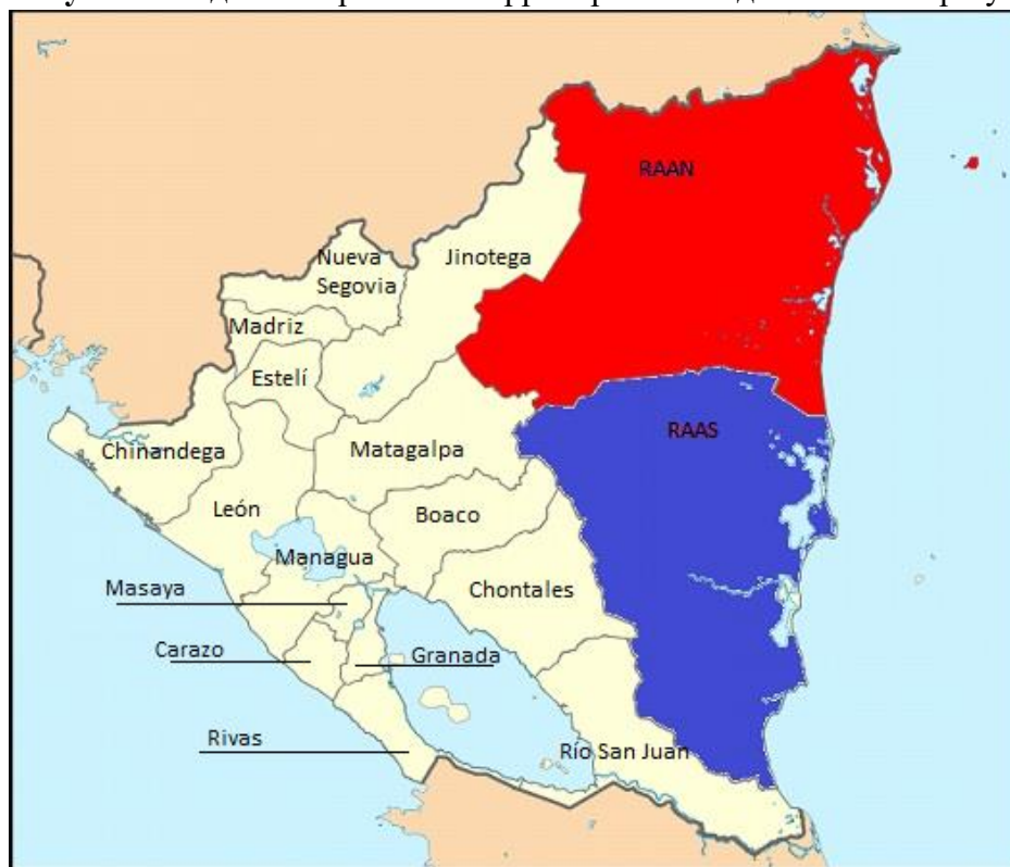
Рисунок 2. Административно-территориальное деление Никарагуа.