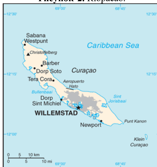
Рисунок 2. Кюрасао.

Кюрасао – самый большой остров Нидерландских Антиль, расположен на юге Карибского моря вблизи берегов Венесуэлы (см. рис. 2).