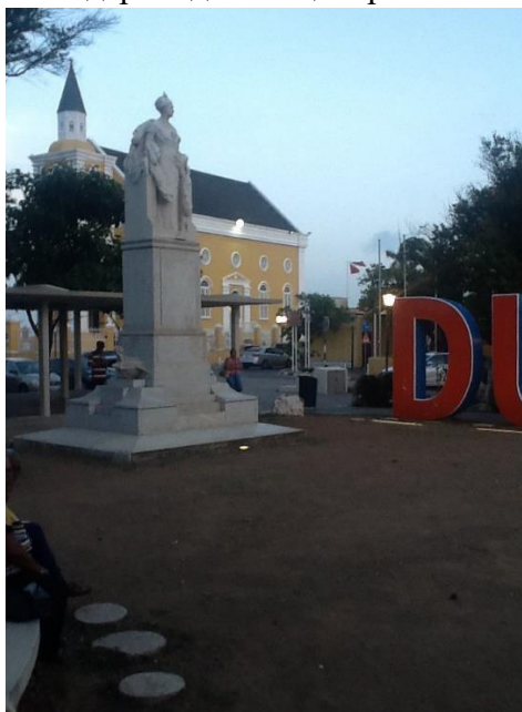
Рисунок 4. Памятник королеве Нидерландов на центральной площади Виллемстада.