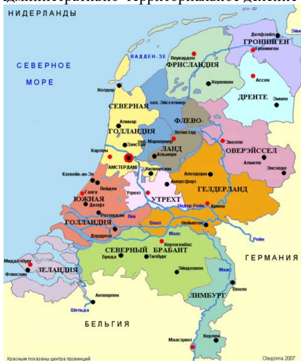
Рисунок 1. Административно-территориальное деление Нидерландов

Исполнительная власть сосредоточена в руках кабинета Нидерландов, состоящего из министров и госсекретарей. Кабинет обязан согласовывать основные решения с парламентом, и поэтому формируется на основе парламентского большинства. Исполнительный орган всей федерации (Королевства Нидерландов) — Государственный совет министров ( Rijksministerraad ), состоящий из всех членов Совета Министров Нидерландов и уполномоченных министров от территорий (других членов федерации).