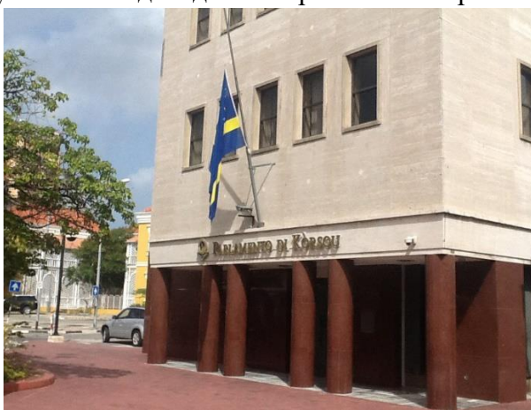
Рисунок 5. Вход в здание парламента Кюрасао.

В Кюрасао парламент состоит из 21 депутата, избираемых по пропорциональной системе, раз в четыре года. Спикер избирается из числа депутатов. Парламент Синт-Мартена состоит из 15 депутатов, также избираемых на четырехлетний период по пропорциональной системе.