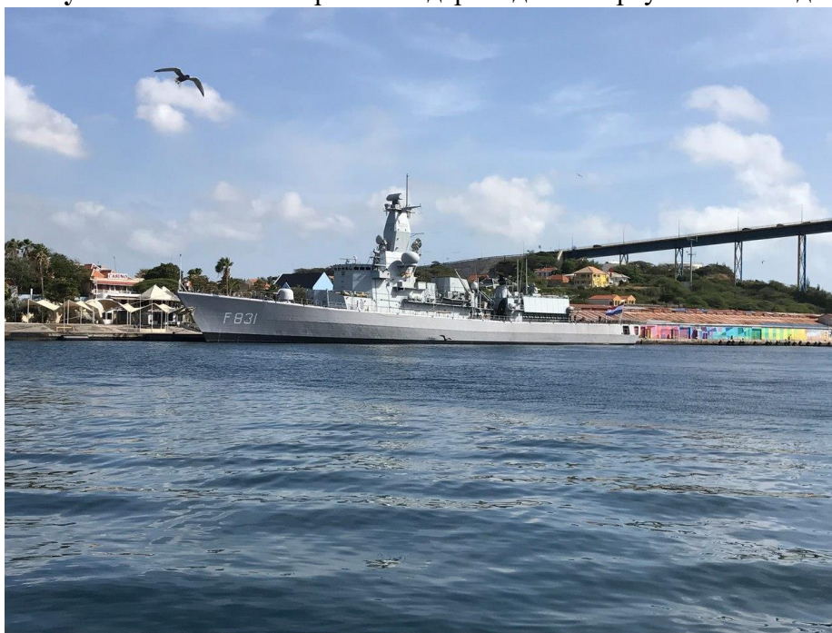
Рисунок 6. Военный корабль Нидерландов в порту Виллемстада.

Главой государств является король Нидерландов, который представлен на островах губернаторами. Губернатор назначается королем по рекомендации соответственно Совета министров Кюрасао или Синт-Мартена. Срок полномочий губернатора – 6 лет. До октября 2010 года Губернатор Нидерландских Антильских островов был также губернатором Кюрасао.