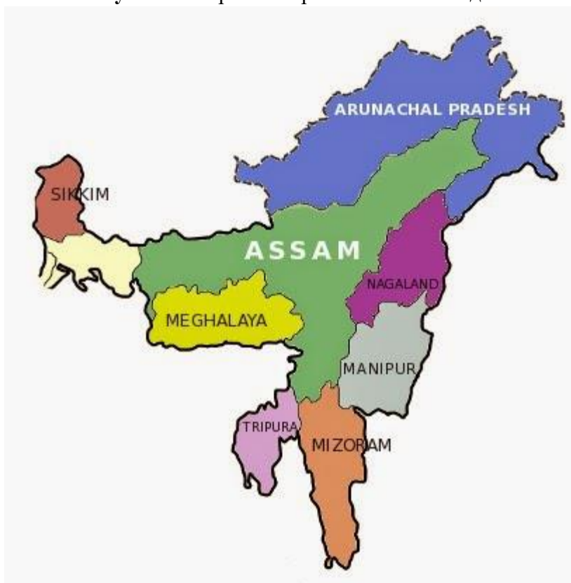
Рисунок 3. Карта Северо-Восточной Индии