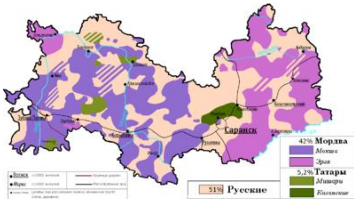
Рисунок 4. Этническая карта республики Мордовия