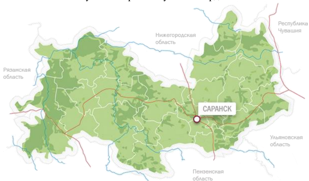
Рисунок 1. Карта Республики Мордовия.