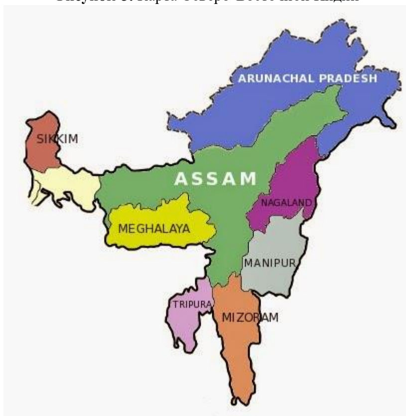
Рисунок 3. Карта Северо-Восточной Индии