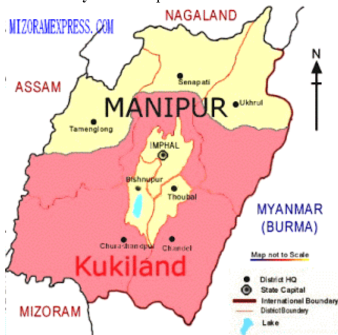
Рисунок 5. Карта «Kukiland»