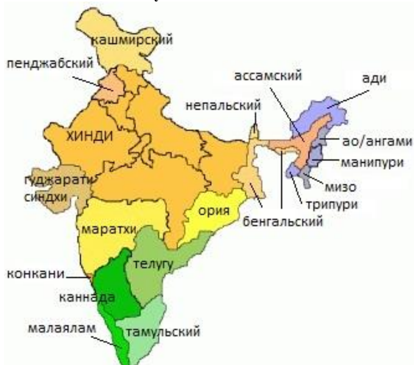
Рисунок 1. Языки Индии