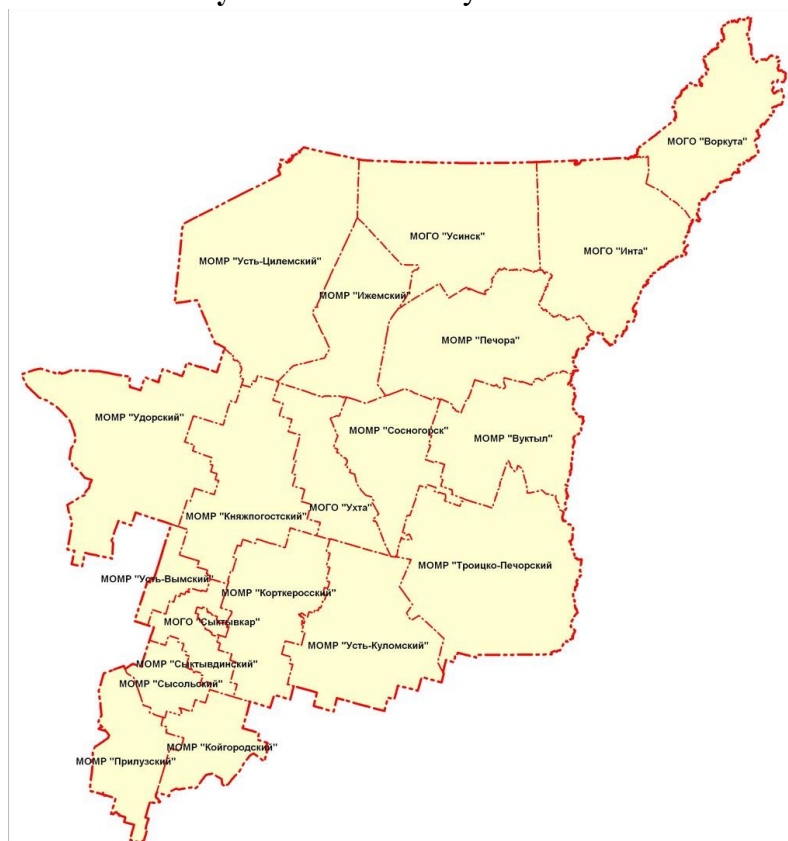
Рисунок 2. АТЕ Республики Коми