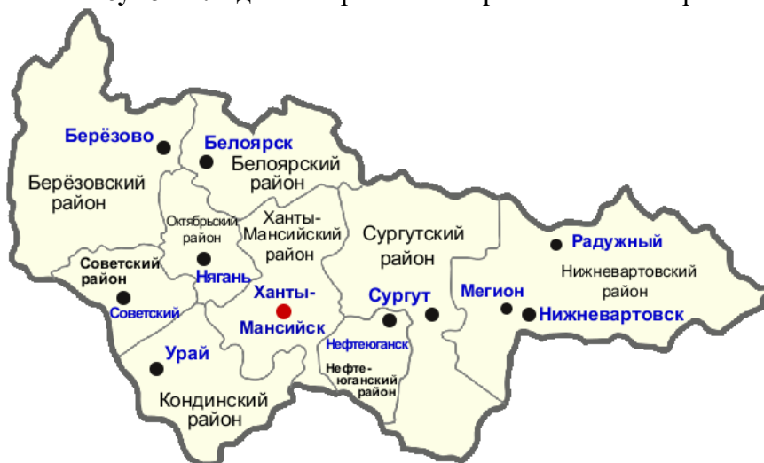
Рисунок 2. Административная карта ХМАО – Югра