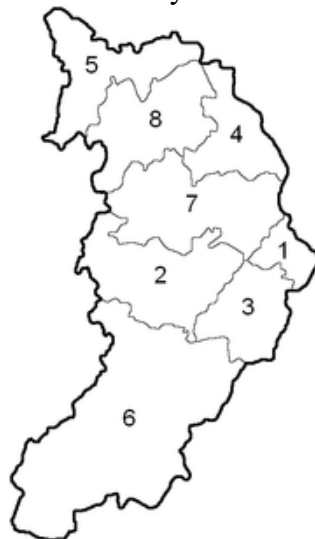
Рисунок 2. АТЕ Республики Хакасия