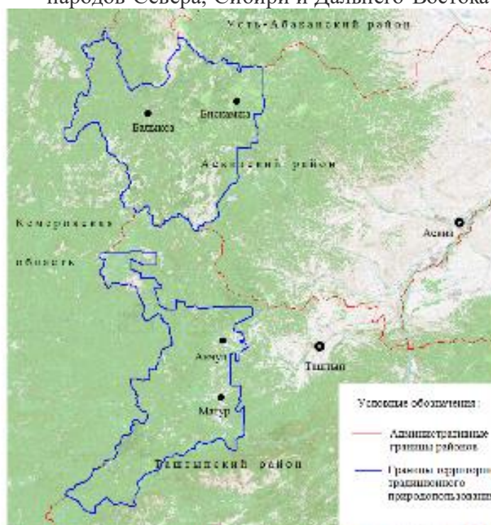
Рисунок 4. Территория традиционного природопользования для коренных малочисленных народов Севера, Сибири и Дальнего Востока