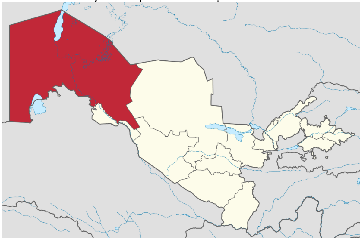
Рисунок 2. Каракалпакстан на карте Узбекистана