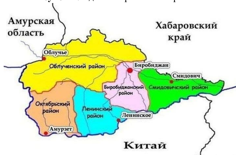
Рисунок 2. Административная карта ЕАО