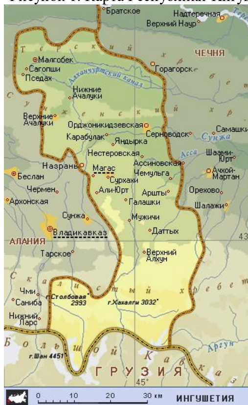
Рисунок 1. Карта Республики Ингушетия

Краткая история ЭРА с момента возникновения до современности. Республика Ингушетия на западе граничит с Северной Осетией, на востоке с Чеченской Республикой, на юге с Грузией (с краем Мцхета-Мтианети), граница с которой совпадает с государственной границей Российской Федерации. Столица — город Магас.