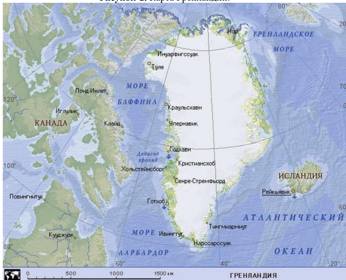
Рисунок 2. Карта Гренландии.

Краткая история ЭРА с момента возникновения до современности. Гренландия – самый крупный остров в мире, находится на северо-востоке Северной Америки. Омывается Атлантическим и Северным Ледовитым океанами. Площадь острова – 2130800 км 2 . Крупнейший населенный пункт острова – Нуук (Готхоб), расположен на полуострове в западной части Гренландии (см. рис. 2).