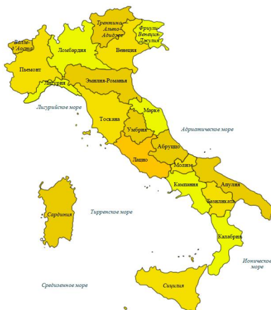
Рисунок 1. Карта регионов Италии