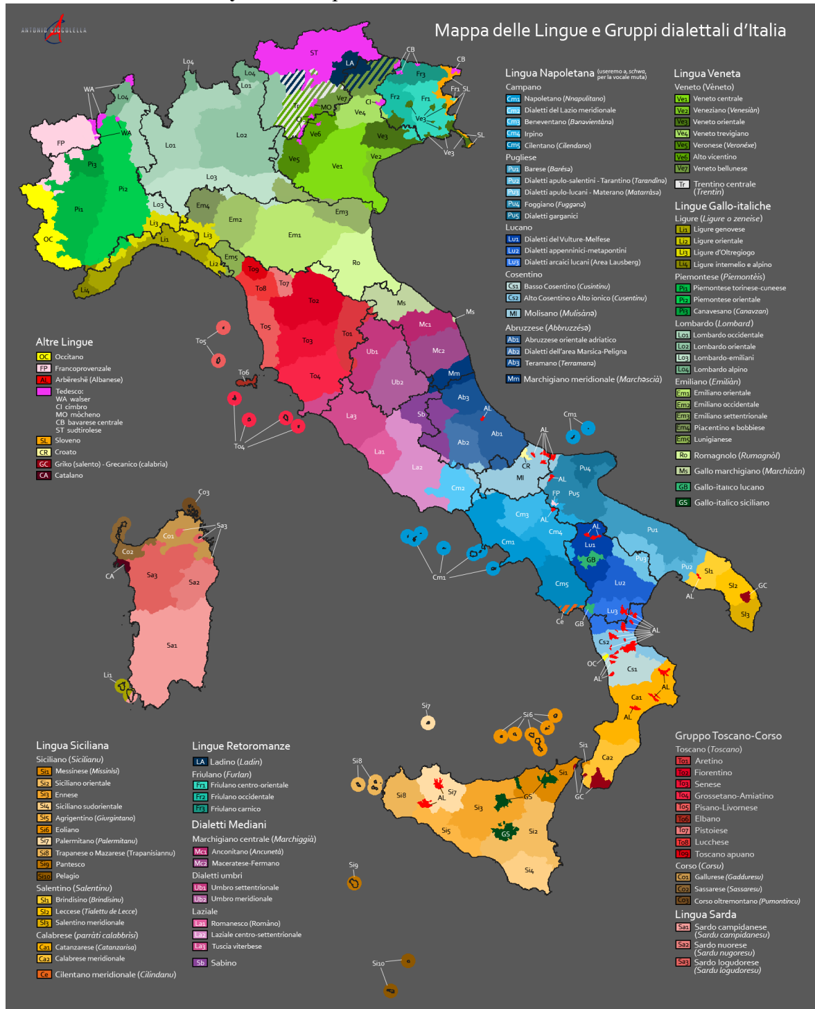
Рисунок 3. Карта языков и диалектов Италии

Author: Antonio Ciccolella https://en.wikipedia.org/wiki/File:Dialetti_e_lingue_in_Italia.png