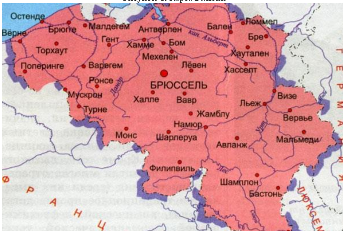
Рисунок 1. Карта Бельгии