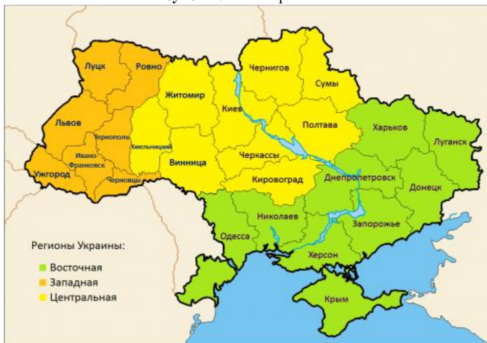
Рисунок 1. АТЕ Украины