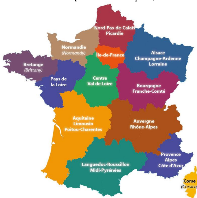
Рисунок 1. АТЕ Франции

Административно-территориальное деление. Франция – унитарное государство, которое в настоящее время делится на 18 регионов (с 2016 г., ранее было 27) (см. рис.1).