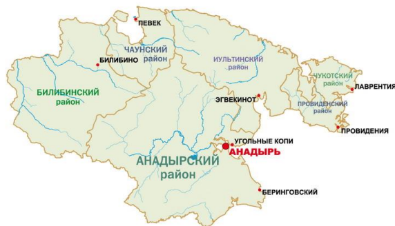
Рисунок 2. Административная карта Чукотского АО