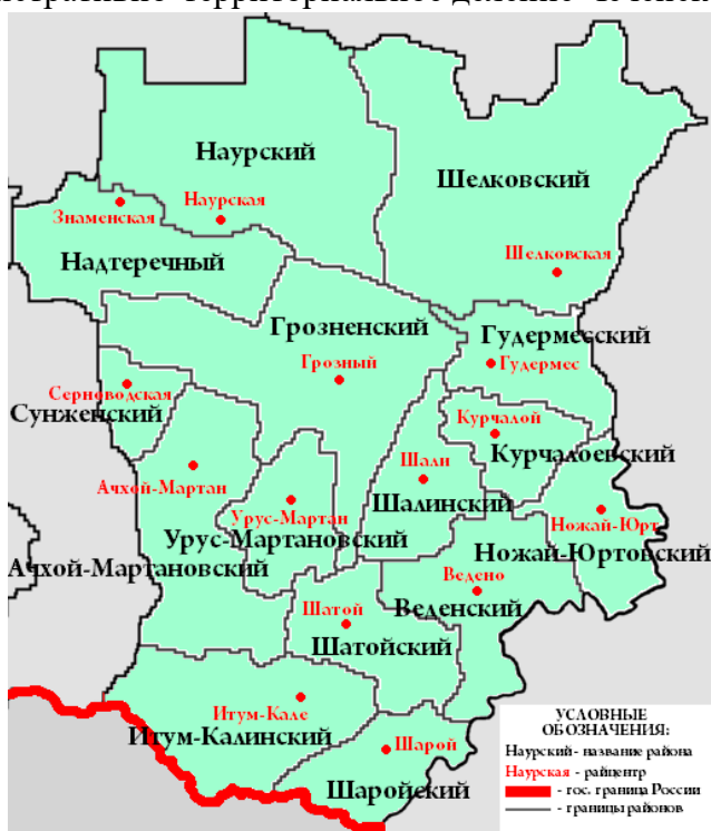
Рисунок 2. Административно-территориальное деление Чеченской республики