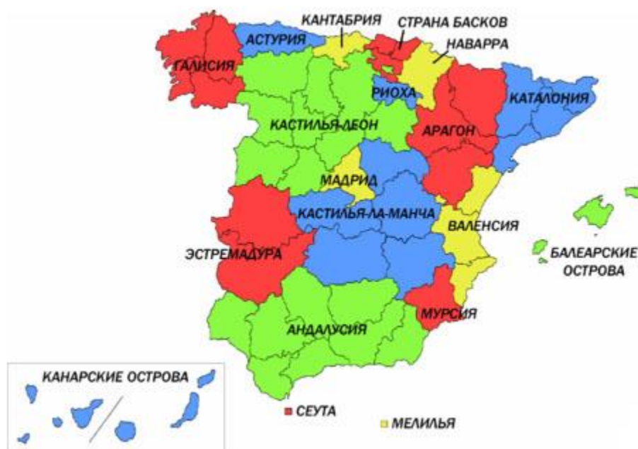
Рисунок 1. АТЕ Испании