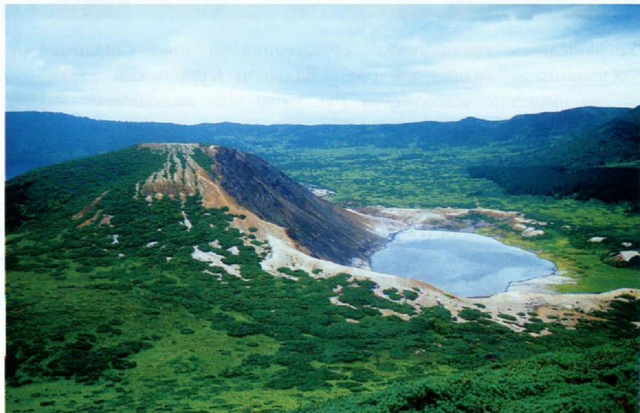
Озеро Кипящее в кальдере вулкана Головнина на острове Кунашир.

В 1956 г. были установлены дипломатические отношения СССР с Японией и принят Совместный договор о передаче Японии островов Шикотан и Хабомай. Однако фактическая передача этих островов должна быть произведена после заключения мирного договора, который до сих пор не подписан из-за оставшихся претензий Японии на Кунашир и Итуруп.