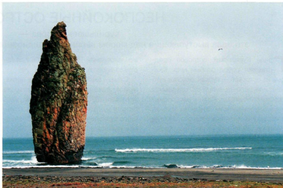
Скала «Чертов палец» у берегов острова Кунашир.

вулканов, а также город и неофициальная «столица» островов в силу его центрального расположения Курильск, основанный в 1946 г в устье реки с «говорящим названием» Курилка.