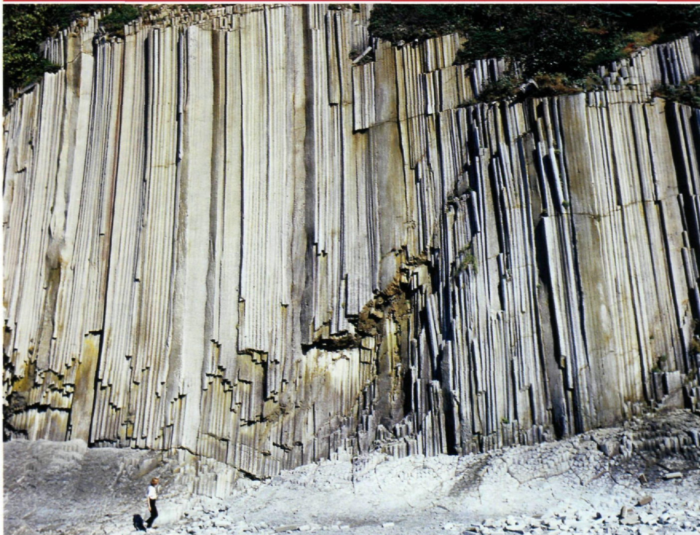
Базальтовая стена на мысе Столбчатый (Кунашир) поразительно напоминает орган.

в толщу воды, а затем поднятых на поверхность.