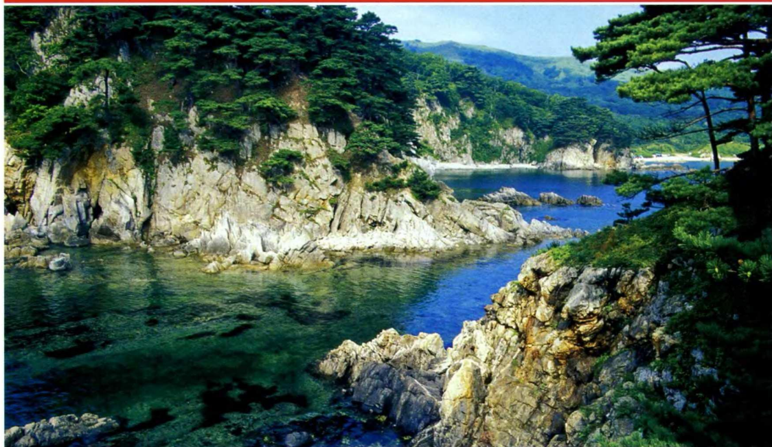
Уссурийская тайга — родина многочисленных эндемиков и муза романтиков.

на западе (в Китае), расположена Приханкайская равнина — самая крупная равнина Приморья и при этом самая обжитая область российского Дальнего Востока. По ней проходит российско-китайская граница, в центре равнины лежит самое крупное озеро Приморья Ханка, также поделенное между Россией и Китаем. С 1996 г озеро Ханка входит в одноименный международный заповедник. Восточно-Манчжурские горы представлены в России хребтом Черных гор, подступающих к Амурскому заливу. По суше Приморский край граничит с Северной Кореей на юге и с Китаем на западе, а по морю прежде всего с Японией.