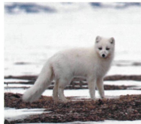
Песец на острове охотится на леммингов и полярных мышей.

В настоящее время поселки на острове заброшены, постоянного населения нет, остров периодически посещают пограничники и редкие группы туристов.