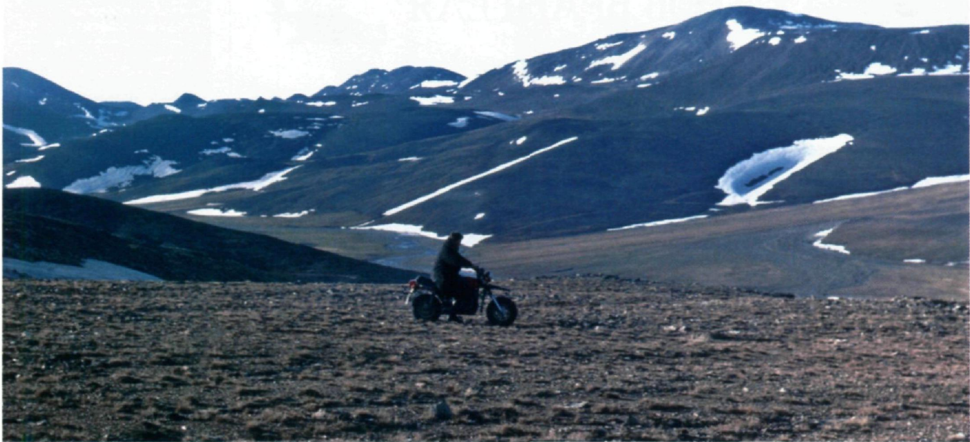
Основной тип ландшафта острова — арктическая тундра и среднегорье, покрытое ледниками.

В 1820 г русское правительство снарядило на северное побережье Сибири две экспедиции: первая искала легендарную «Землю Санникова», вторая под командованием выдающегося российского мореплавателя и полярного исследователя Фердинанда Петровича Врангеля (1796/1797–1870 гг.) отправилась на поиски совсем мифической «земли Андреева».