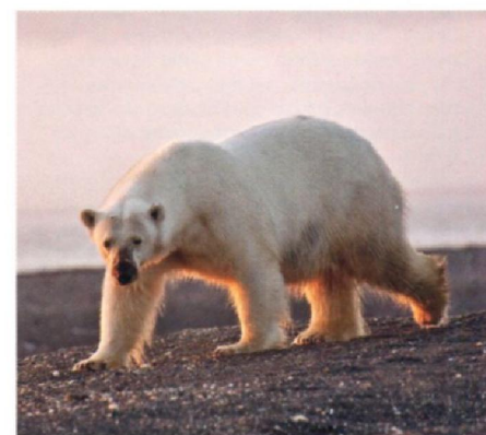
Белые медведицы проходят сотни километров по льду, чтобы добраться до острова Врангеля и вывести потомство.

Воды вокруг острова изучены слабо. Когда лето близится к концу, к берегам острова приплывают для нагула и миграций серый кит, косатка, белуха, горбач, финвал