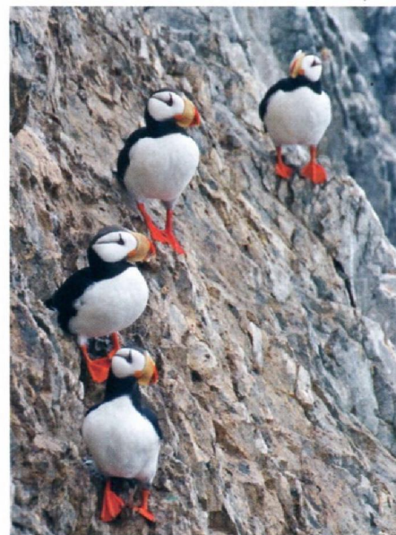
Тихоокеанский тупик, или штатка, живет в длинных норах, которые сам роет.

на вертолете на высоте ниже 2 км, разрешено наблюдение за овцебыками, оленями, серыми китами, тундровыми и морскими птицами. Когда ледовая обстановка позволяет, посетители заповедника могут пройти несколько водных маршрутов на лодке по бухте Сомнительной и заливу Красина.